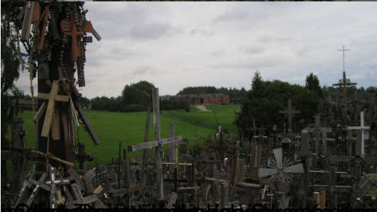
atpašigirškijok) pasisųšielėjis (ar) pafDias, em (w) samanašito