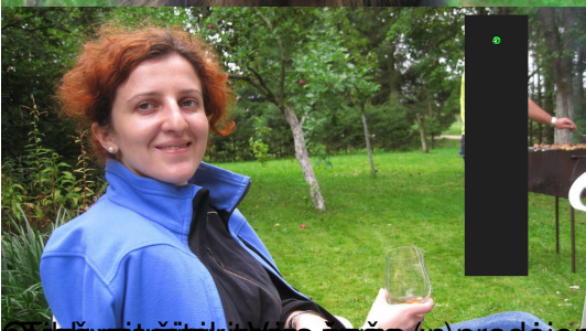
pačakšyatsųjauitame žaše (n) pradėjom popiergalius visokius tvarkytis :) kaip seksis toliau